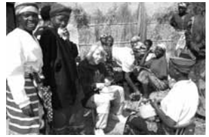
Kochen für das Fest

Unsere Gemeinde hat von Philippus gelernt, über den eigenen Kirchturm hinaus zu schauen. Die Kirche ist eine globale, weltweite (auf Griechisch: „ökumenische“) Gemeinschaft. Eine Gemeinschaft gegenseitiger Verpflichtung und solidarischer Verantwortung. Eine Gemeinschaft, für die die Grenzüberschreitung, die Philippus zuerst praktizierte, bleibender Maßstab sein muss. Nach dem Motto: „Weltweit – füreinander beten, voneinander lernen, miteinander teilen.“