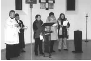
Ökumenischer Gottesdienst in der Aussegnungshalle Markt Schwaben