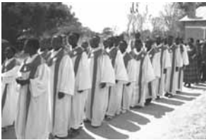
Festeinzug zur Feier des 20-jährigen Jubiläums, August 2004, Tansania

Und trotzdem ist dieses ökumenische, Grenzen überschreitende Engagement der Gemeinde stets bedroht von Missverständnissen. Denn immer hat dieses Engagement auch mit Geld zu tun. Geld aber ist stets Segen und Fluch. Deshalb hat Jesus vom „schmutzigen Geld“ gesprochen und dennoch dazu aufgefordert: „Macht euch Freunde mit dem ungerechten Mammon!“ Als Segenszeichen wird das Geld gegeben. Zum Fluch wird es, wenn dadurch aus Freunden Abhängige werden, die „lieb Kind“ spielen, nur um die Geldgeber nicht zu verprellen. Zum Fluch wird es, wenn die