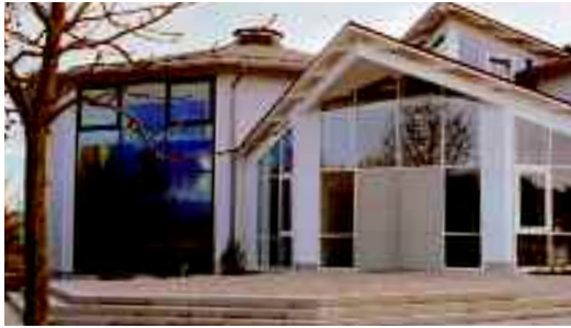
Christuskirche in Poing