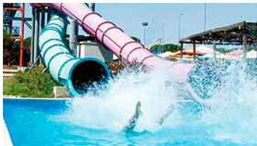
Wasserpark in der Toskana- Ziel unserer Jugendfreizeit.