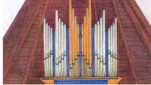
So soll die neue Orgel der Philippuskirche aussehen.