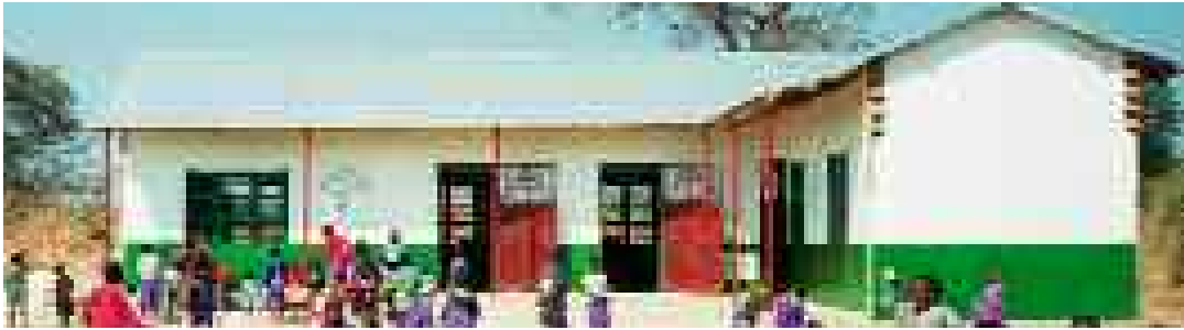
Der neue Kindergarten in Palangavau.