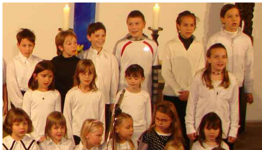
Buben und Mädchen im Kinderchor.