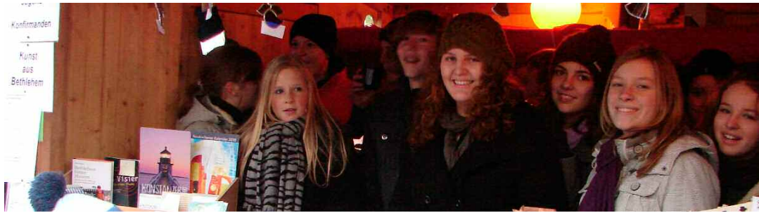
Nicht nur auf der Freizeit, auch beim Adventsmarkt hatten die Konfirmanden viel Spaß.