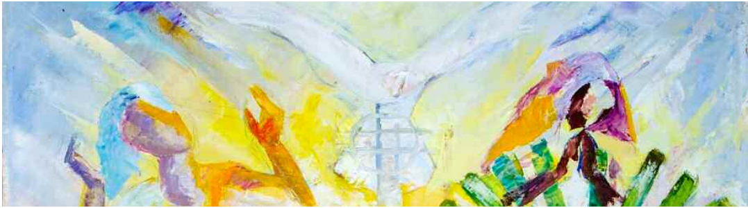
Lob dem Ewigen – Bild aus Kamerun.