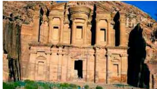
Der größte Grabtempel in Petra, Ed Deir