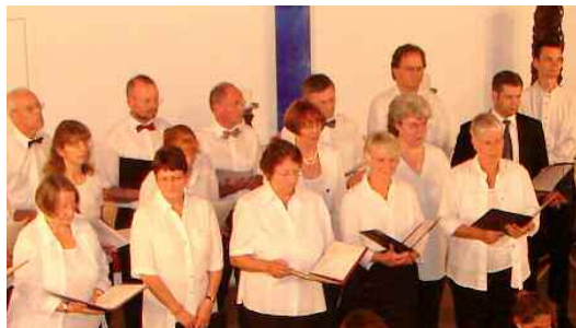
Mitglieder unserer Kantorei.