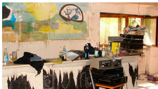
Discoraum während der Renovierungsarbeiten.