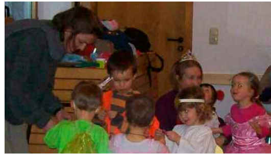
Fasching in der Eltern-Kind-Gruppe.