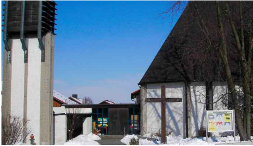
Philippuskirche im Winter.