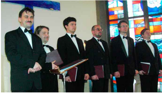
Anima aus St. Petersburg singt am Karfreitag.