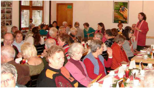
„Seniorenrunde im Advent.“